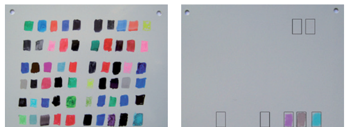
60 Farben VOR der Reinigung geprüft,